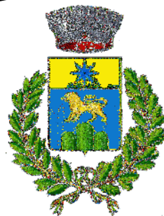
Comune di Rovito