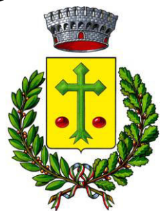
Comune di Lappano